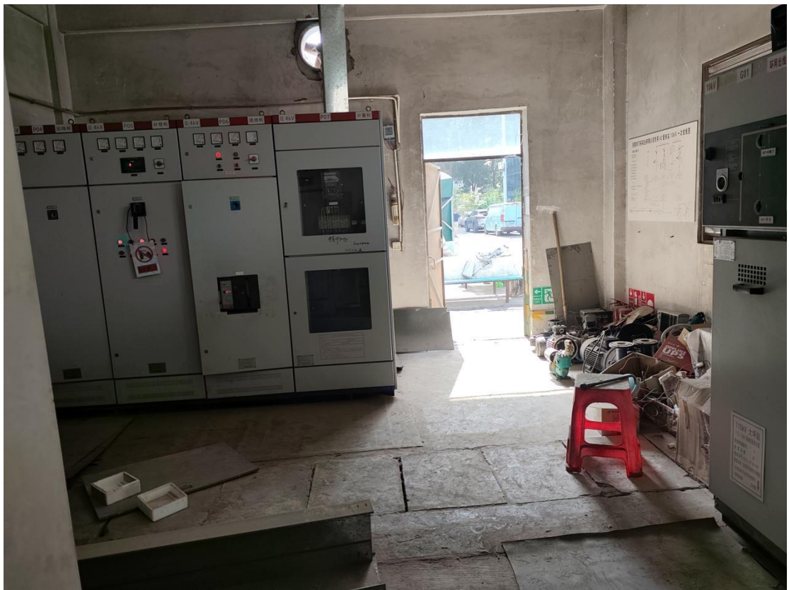
图 1-4 内部电房图