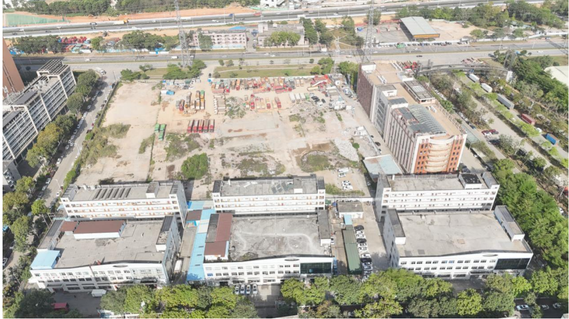
图 1-1 现场航拍图