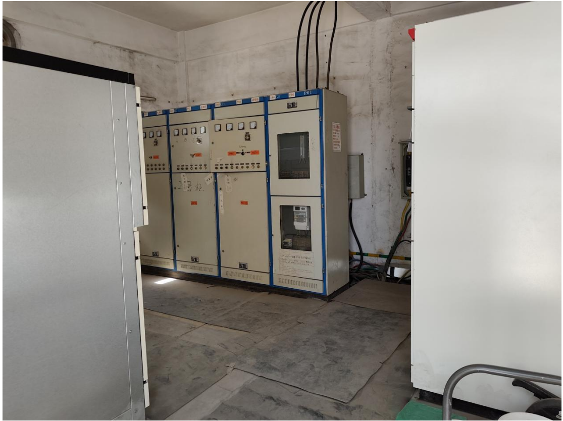
图 1-3 内部电房图